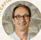
Christoph Stoll Weingut Stoll weingut-stoll.ch