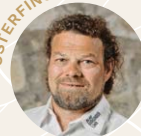
Matthias Richli Weinkellerei zum Hirschen richli-hirschen.ch