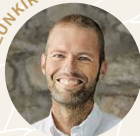
Markus Ruch Weinbau Markus Ruch weinbauruch.ch