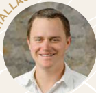
Lukas Bringolf Bringolf Weinbau bringolf-weinbau.ch